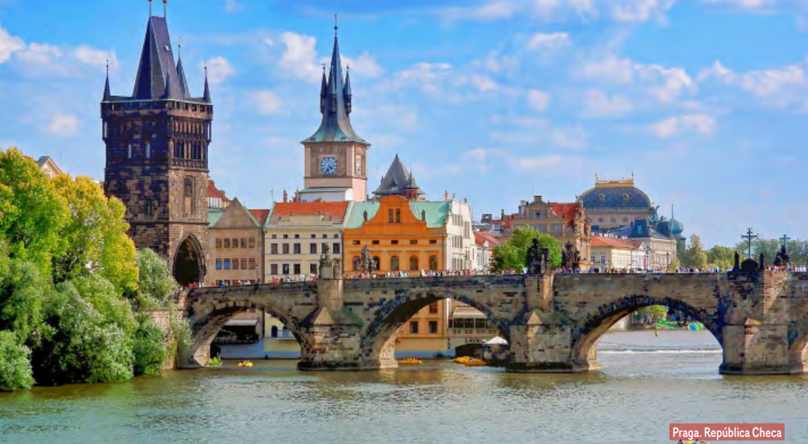
Praga. República Checa