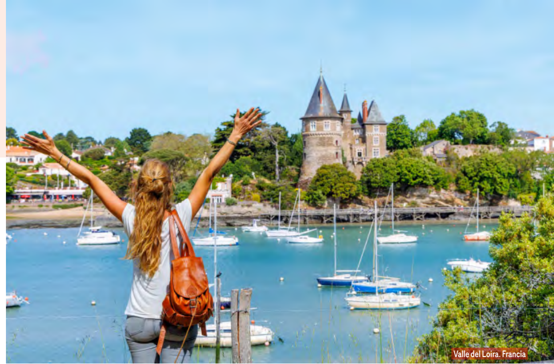
Valle del Loira. Francia

Desayuno y salida hacia Bélgica para llegar a la bella y romántica ciudad de Brujas. Tiempo libre para pasear por el casco antiguo y conocer el Lago del Amor, sus románticos canales, bellos edificios e iglesias. Continuación hacia Bruselas. Posibilidad de realizar opcionalmente una visita para conocer algunos