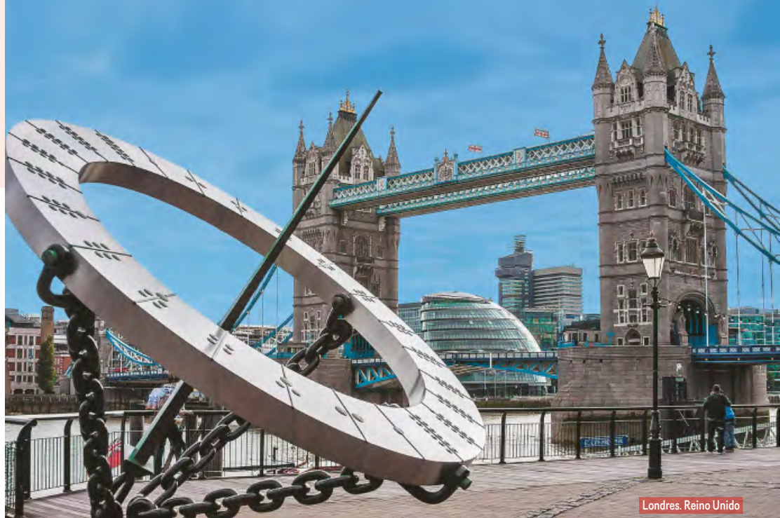
Londres. Reino Unido

Desayuno y fin de nuestros servicios. Posibilidad de ampliar su estancia en España o participar en un circuito por Andalucía o Portugal.