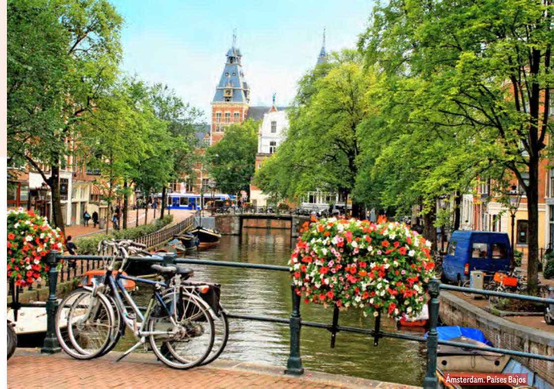
Ámsterdam. Países Bajos

Desayuno y salida hacia Rotterdam, segunda ciudad en importancia de Holanda. Breve recorrido panorámico y continuación hacia La Haya, capital administrativa, con breve parada para conocer los edificios que contienen los distintos organis-