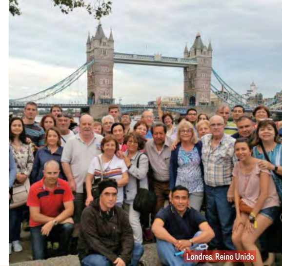
Londres, Reino Unido