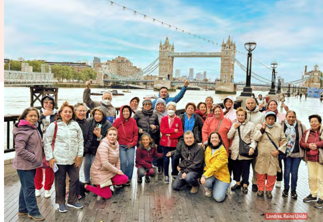
Londres, Reino Unido