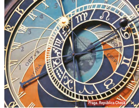
Praga. República Checa

Alojamiento y desayuno. Visita panorámica de la Ciudad Imperial: Piazza Venezia, Foros Imperiales, Coliseo, Arco de Constantino, Circo Máximo y la imponente Plaza de San Pedro en el Vaticano. Posibilidad de visitar, opcionalmente, los famosos Museos Vaticanos, la Capilla Sixtina con los frescos de Miguel Ángel y el interior de la Basílica de San Pedro, utilizando nuestras reservas exclusivas, evitando así las largas esperas de ingreso. Por la tarde, podrá realizar una visita opcional para conocer la Roma Barroca, con sus famosas fuentes, plazas y palacios papales desde los que se gobernaron los Estados Pontificios.