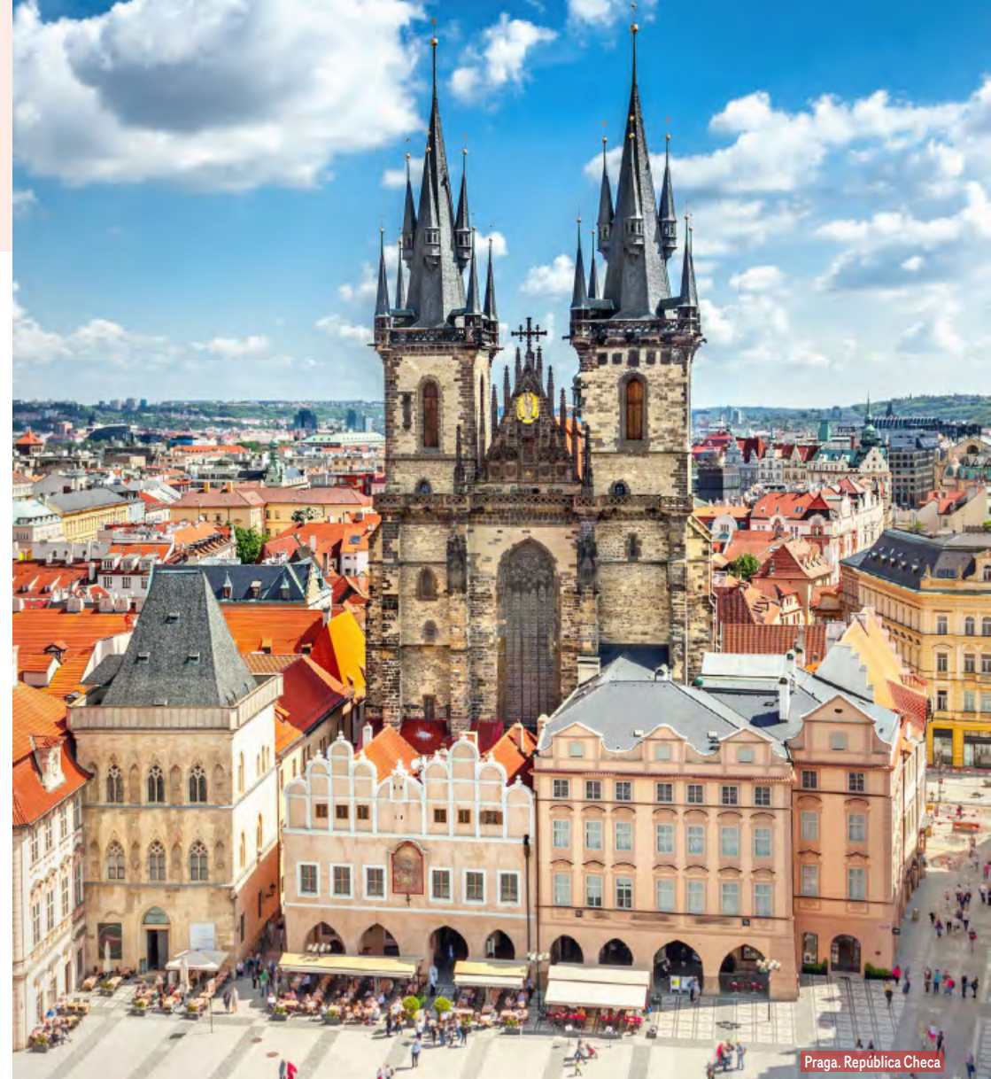
Praga. República Checa

Desayuno. Salida via Graz, Klagenfurt y Villach a través de impresionantes paisajes alpinos para cruzar posteriormente